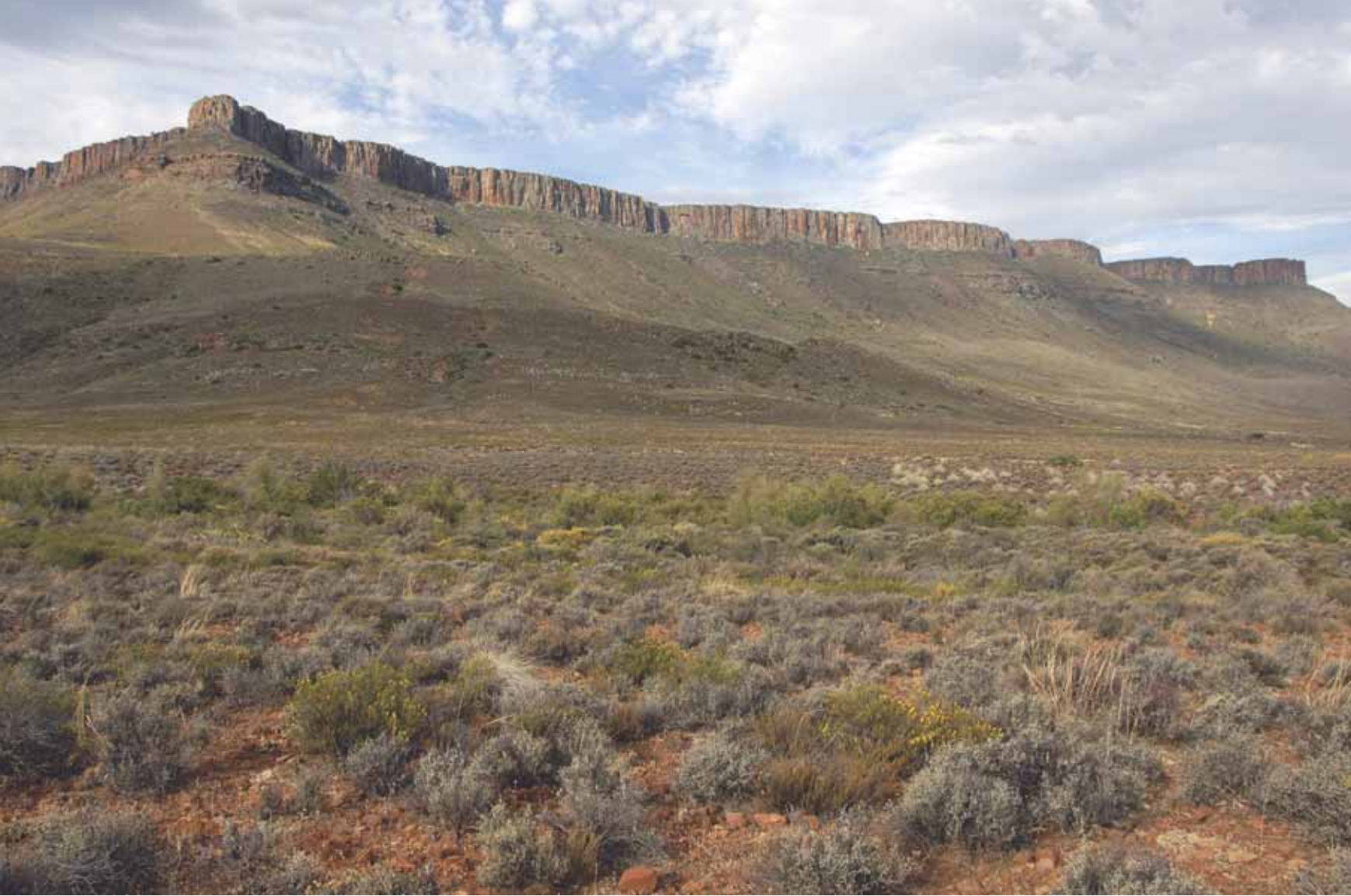
Boven De fraaie Hatam Range nabij Calvinia Onder links Bij eb kun je naar de vuurtoren van Corbière Point lopen Onder links De overdonderende Augrabies Falls Onder rechts Fraaie rotspartijen in Augrabies Falls National Park