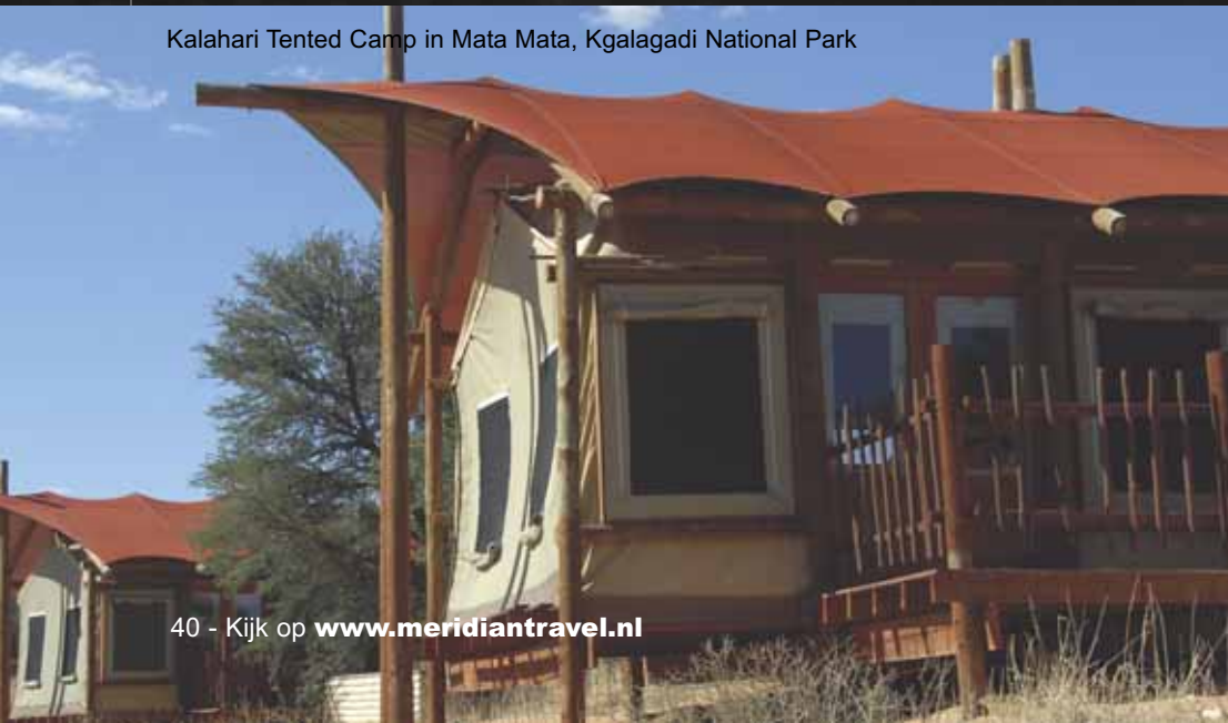
Kalahari Tented Camp in Mata Mata, Kgalagadi National Park

In de Noordkaap zijn de overnachtingsmogelijkheden niet talrijk. Daarom is het te overwegen om vooraf je accommodaties vast te leggen. Als je een fly-drive boekt is dat al voor je geregeld. Meridian Travel! overnachtte bij Die Hatam Huis, Calvinia; Augrabies Falls National Park; Twee Rivieren Camp en Kalahari Tented Camp, Kgalagadi Transfrontier National Park; !Xaus Lodge, Kgalagadi Transfrontier National Park (als je boekt bij QAS holidays voor de periode van oktober 2010 tot 1 april 2011 krijg je dertig procent korting bij de !Xaus Lodge; zie www.qasholidays.nl ); Uitspan Guest Farm, nabij Upington; en De Herberg Lodge, De Aar.