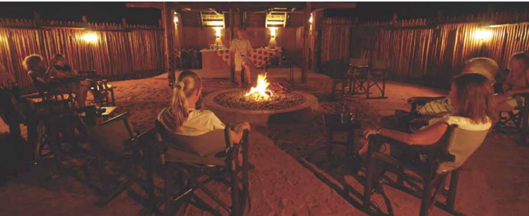
Aan de braai bij de Xaus Lodge

Lodge een aanrader. De alleen met een terreinwagen bereikbare lodge ligt op zestig kilometer van de Auobrivier, op de grens van het nationale park. De !Xaus Loge biedt de mogelijkheid om volledig ongestoord te kunnen genieten van de wildernis van de Kalahari, maar dan wel in alle comfort. En misschien nog wel belangrijker, hier bevind je je op een kruispunt van de geschiedenis en cultuur van de Bosjesmannen.